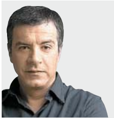
ΤΟΥ ΣΤΑΥΡΟΥ ΘΕΟΔΩΡΑΚΗ