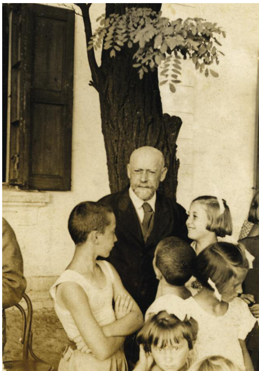
Ο «Γερο-Δόκτωρ» με τα παιδιά του ορφανοτροφείου.

Δεν θέλω να γίνω εικονοκλάστης και να απομυθοποιήσω μερικά πράγματα, αλλά πρέπει να πω πώς το είδα τότε. Η ατμόσφαιρα ήταν διαποτισμένη με τεράστια αδράνεια, αυτοματισμό και απάθεια. Δεν υπήρξε ορατή συγκίνηση για το πρόσωπο του Κόρτσακ, δεν υπήρχαν στρατιωτικοί χαιρετισμοί (όπως περιγράφουν κάποιοι), σίγουρα δεν υπήρχε παρέμβαση του Judenrat – κανείς δεν πλησίασε τον Κόρτσακ. Δεν υπήρχαν χειρονομίες, δεν υπήρχαν τραγούδια, ούτε υπε-