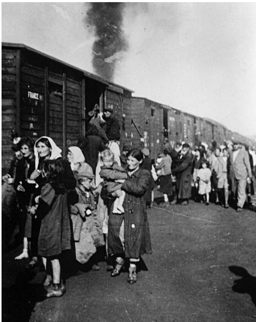
1942. Πολωνοί Εβραίοι από το γκέτο της Βαρσοβίας οδηγούνται με τρένα στο στρατόπεδο της Τρεμπλίνκα. Με τον ίδιο τρόπο, τον Αύγουστο της ίδιας χρονιάς, οδηγήθηκαν στη μαζική εξόντωση, ο Γιάνους Κόρτσας και τα παιδιά του ορφανοτροφείου που διεύθυνε.

Ποιος είναι ο Γιάνους Κόρτσας; Δίκαια θα αναρωτούνται οι περισσότεροι έλληνες αναγνώστες, αφού το έργο του πασίγνωστου σε άλλα μέρη του κόσμου πολωνοεβραίου γιατρού, παιδαγωγού και συγγραφέα, δυστυχώς, είναι σχεδόν άγνωστο στην Ελλάδα. Μια μικρή έρευνα που πραγματοποίησα στον κύκλο των γνωστών μου έδειξε πως στην Ελλάδα το όνομά του συνδέεται κυρίως με το ομότιτλο κινηματογραφικό έργο του Αντρέι Βάιντα ( Korczak , 1990). Οι φανατικοί λάτρες της Δέκατης Μούσας μπορεί να ξέρουν και ένα άλλο φιλμ αφιερωμένο στον Γιάνους Κόρτσας, μια γερmano-ισραηλινή παραγωγή του 1974 σε σκηνοθεσία